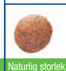
400 g, 1.5, 3.5, 6 och 9 kg