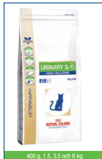
400 g, 1.5, 3.5 och 6 kg

Magnesium ingår som komponent i struvitstenar. Med ett lågt magnesiuminnehåll minskar risken för bildning av struvitkristaller.