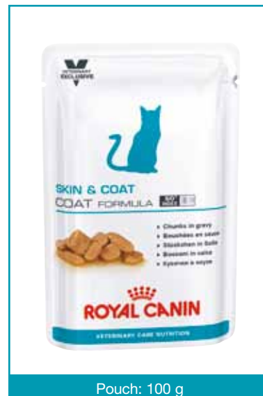
Pouch: 100 g

Symbolen S/O-index garanterar att fodret främjar en miljö i urinvägarna som är ogynnsam för bildandet av kristaller av typen struvit och kalciumoxalat.