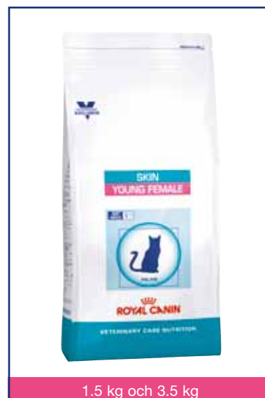
1.5 kg och 3.5 kg

Symbolen S/O-index garanterar att fodret främjar en miljö i urinvägarna som är ogynnsam för bildandet av kristaller av typen struvit och kalciumoxalat.