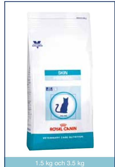
1.5 kg och 3.5 kg

Symbolen S/O-index garanterar att fodret främjar en miljö i urinvägarna som är ogynnsam för bildandet av kristaller av typen struvit och kalciumoxalat.