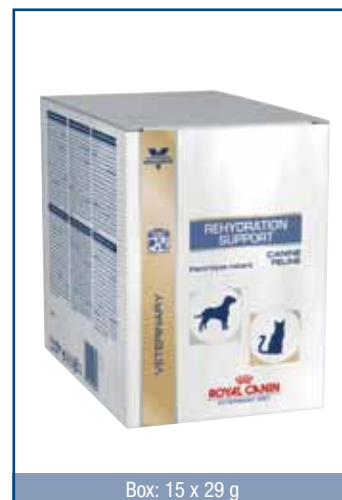
Box: 15 x 29 g