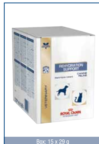
Box: 15 x 29 g

Maltodextrin, glycin, natriumcitrat, kaliumklorid, natriumklorid.