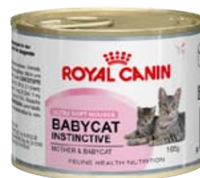
Burk: 195 g

En kombination av lättsmälta proteiner och prebiotika bidrar till att stödja magtarmkanalens hälsa.