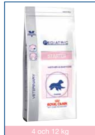
4 och 12 kg

I början på avvänjningen blöts torrfodret upp i dubbelt så mycket varmt vatten (60 grader). Foderbitarnas storlek, struktur och form är anpassade för att snabbt ge en lämplig konsistens.