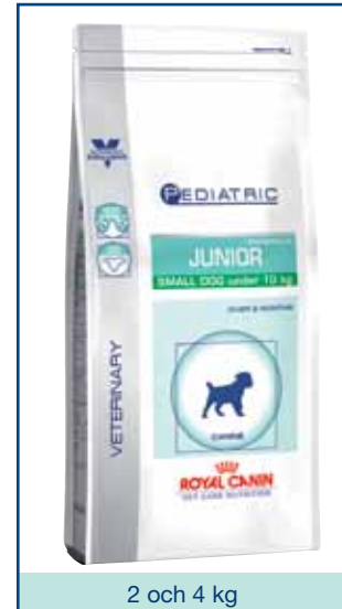
2 och 4 kg

Prebiotika tillsammans med ett patenterat antioxidantkomplex (vitamin E och C, taurin och lutein) hjälper till att stödja den växande hundens naturliga försvar.