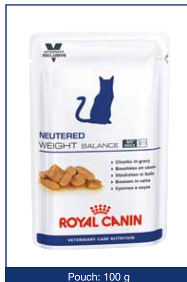
Pouch: 100 g

Symbolen S/O-index garanterar att fodret främjar en miljö i urinvägarna som är ogynnsam för bildandet av kristaller av typen struvit och kalciumoxalat.