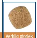
1.5, 6 och 12 kg