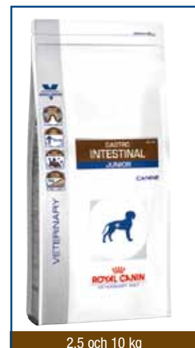
2.5 och 10 kg