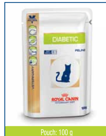
Pouch: 100 g

Ett lågt innehåll av stärkelse hjälper till att kontrollera blodsockerkurvan efter måltid, vilket underlättar behandlingen av diabetes.