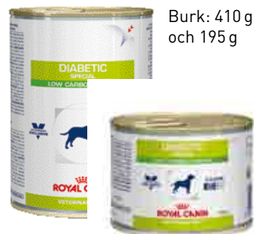
Burk: 410 g och 195 g