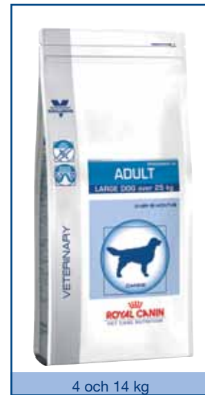
4 och 14 kg

Ett antioxidantkomplex (vitamin E och C, taurin och lutein) hjälper till att neutralisera fria radikaler.